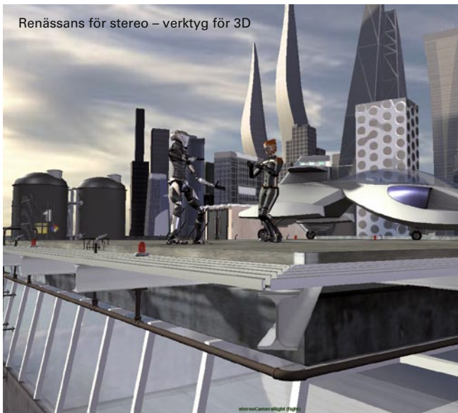
Capture Polar - nya visioner för Capture