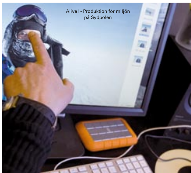
Alive! - Produktion för miljön på Sydpolen