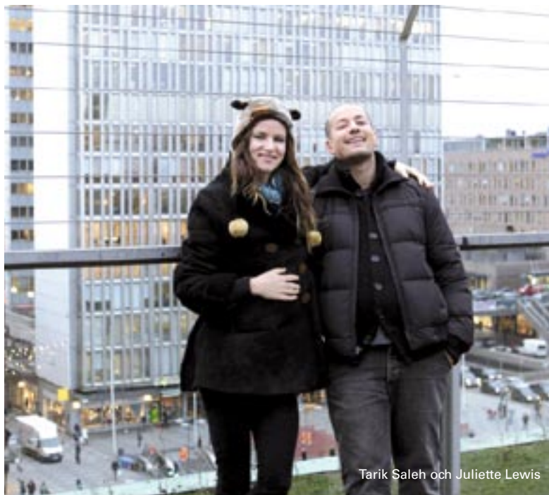
Tarik Saleh och Juliette Lewis