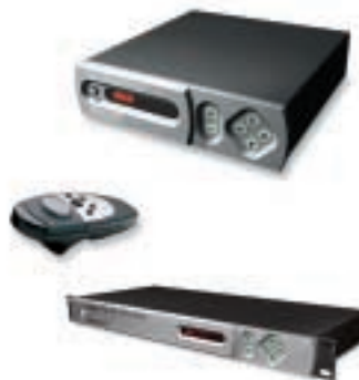
TView Pro AV 1600 i desktop och rack utförande, fjärrkontroll

För mer information - besök vår site www.tura.se