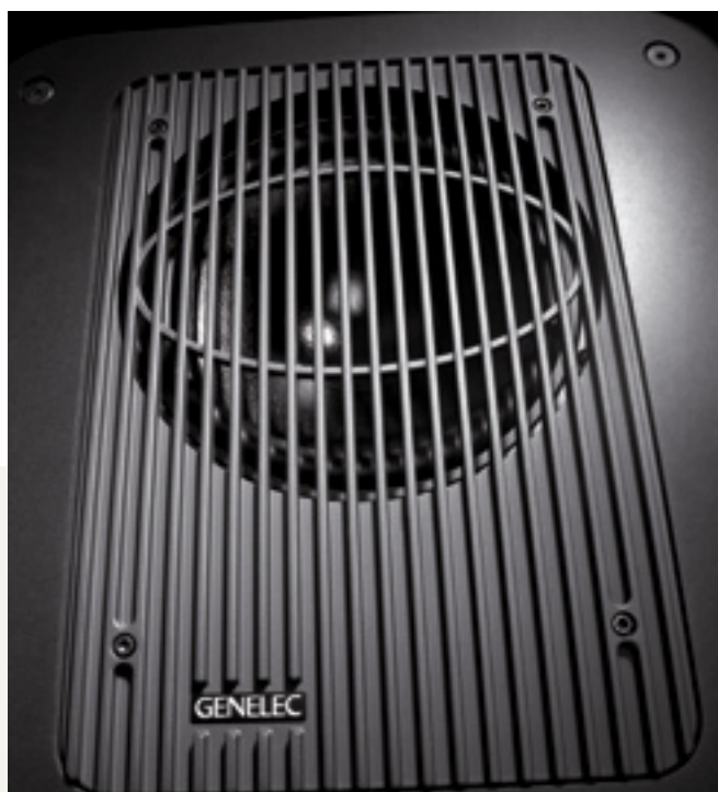
Genelec SE DSP System, 5.1